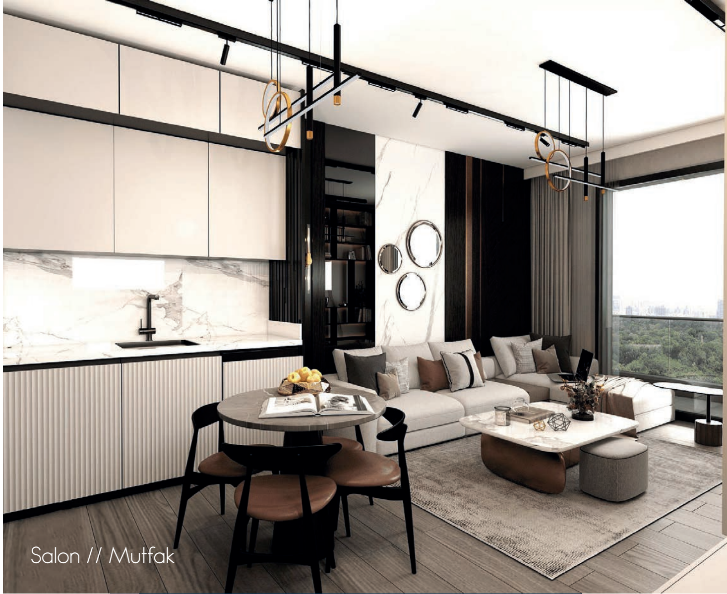
Salon // Mutfak